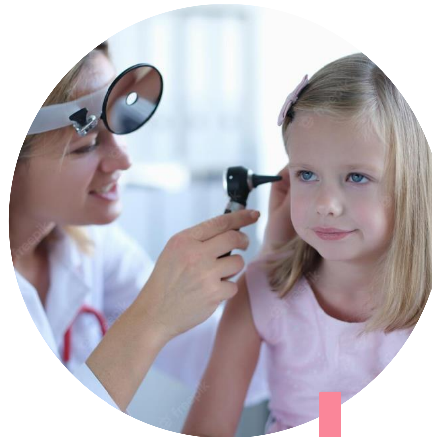
Право на охрану здоровья