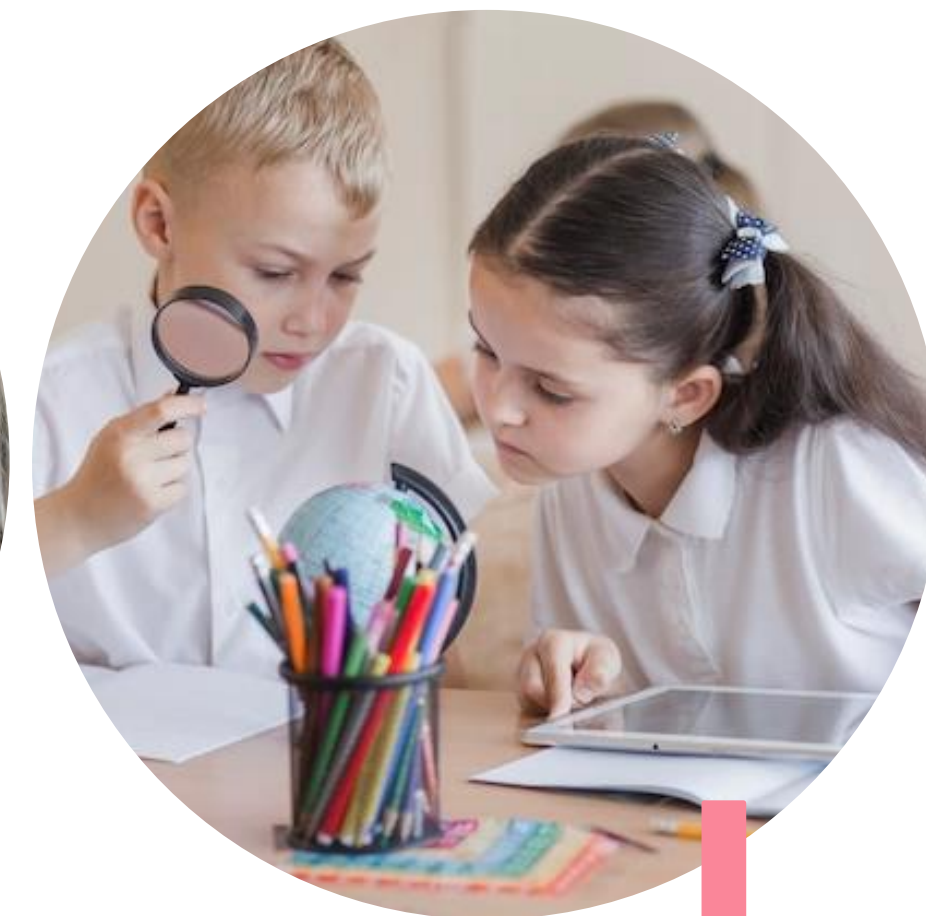
Право на образование