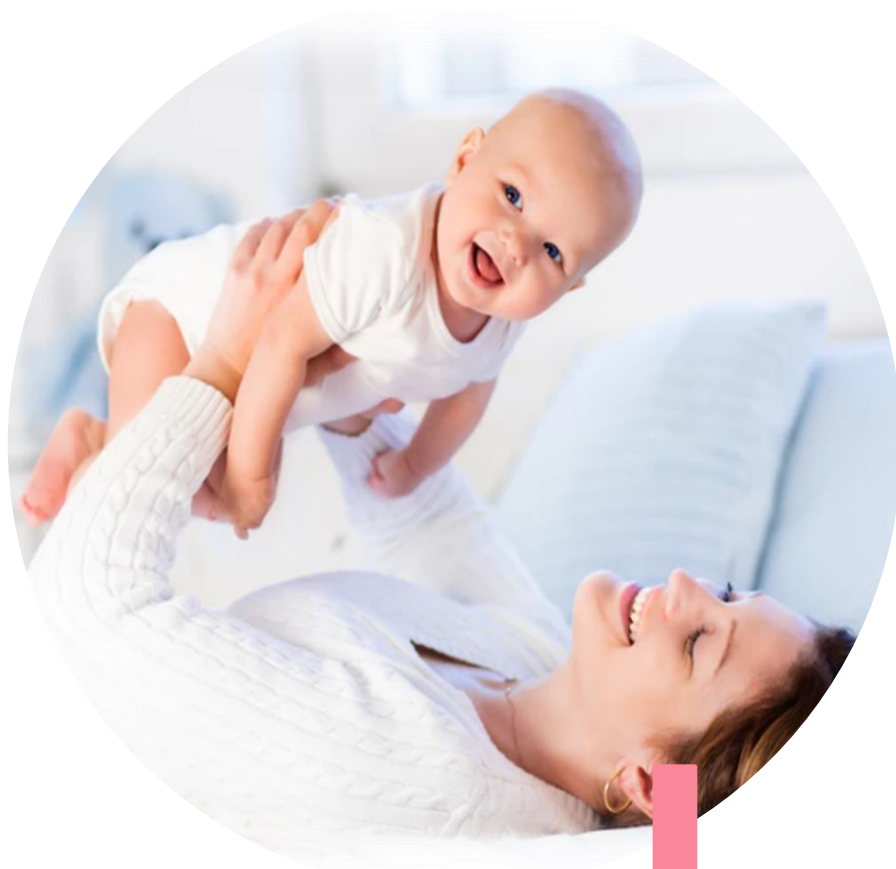
Право на жизнь

Конституция России закрепляет права и устанавливает обязанности граждан. Права человека — это высшая ценность, они защищают граждан, позволяют им учиться, работать, развиваться