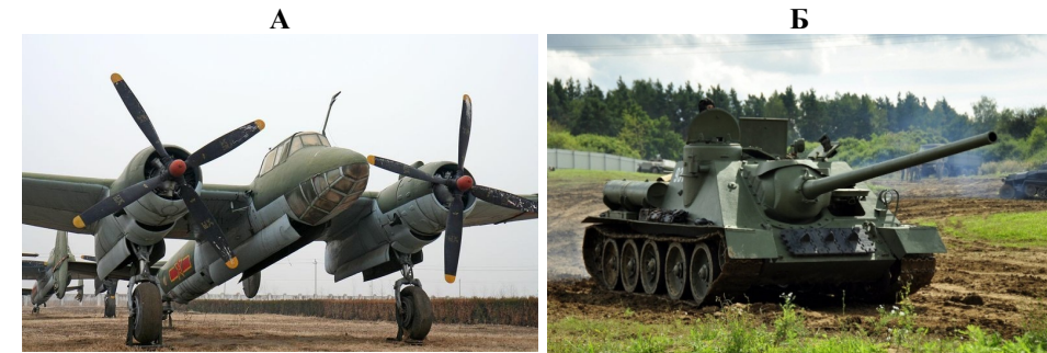
А фронтальной бомбардировщик

Рассмотрите две обозначенные буквами иллюстрации, на которых изображены образцы советской военной техники периода Великой Отечественной войны.